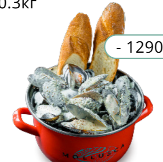
Пармезан, сливки, чёрный перец

Халапеньо 1700 Jalapeño Грибной соус 1900 Mushroom sauce