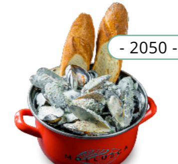
Пармезан, сливки, черный перец - 2050 -