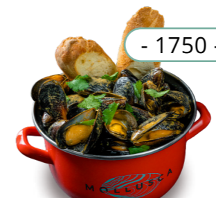
Маринара - 1750 -