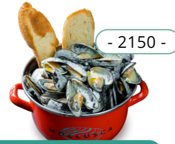
Сливки, трюфель - 2150 -