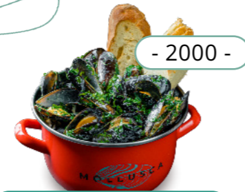
Сливки, петрушка - 2000 -