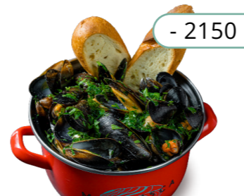
Том-ям - 2150 -