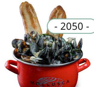
Блючиз - 2050 -