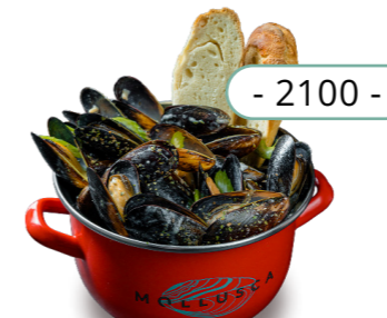
Прованские травы - 2100 -