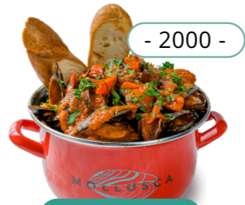
Гаспаччо - 2000 -