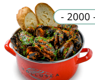
Аррабиата - 2000 -