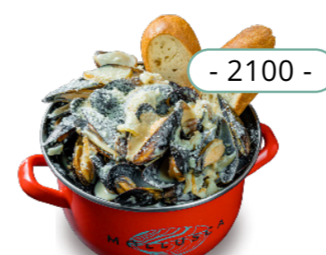
Груша, пармезан - 2100 -