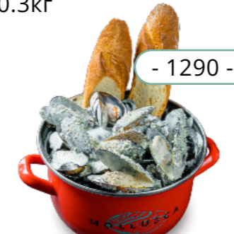
Пармезан, сливки, черный перец 0.3кг

Халапеньо Jalapeño 1700 Грибной соус Mushroom sauce 1900