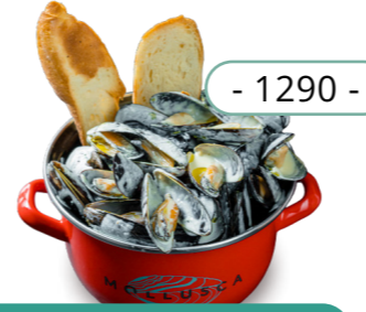
Сливки, трюфель 0.3кг