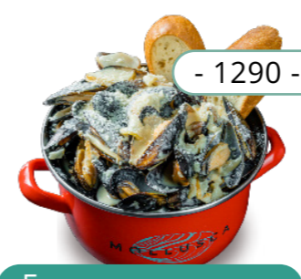
Груша, пармезан 0.3кг