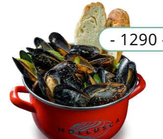
Прованские травы 0.3кг