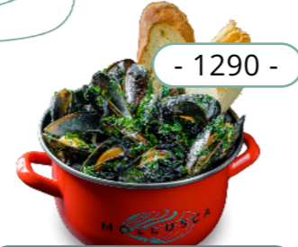
Сливки, петрушка 0.3кг